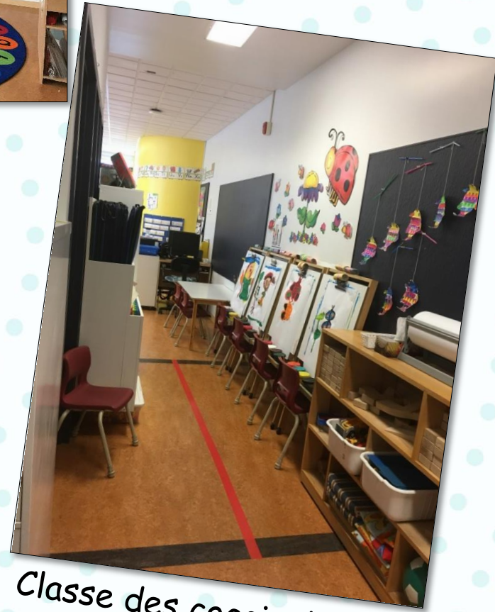
Classe des coccinelles