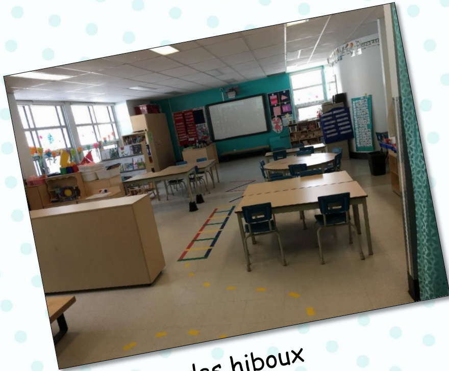
Classe des hiboux

À l'école Saint-Claude il y a 3 classes de maternelle 5 ans. En juin, tu seras invité à venir nous visiter. Regarde nos classes ! Est-ce que tu reconnais des jeux ?