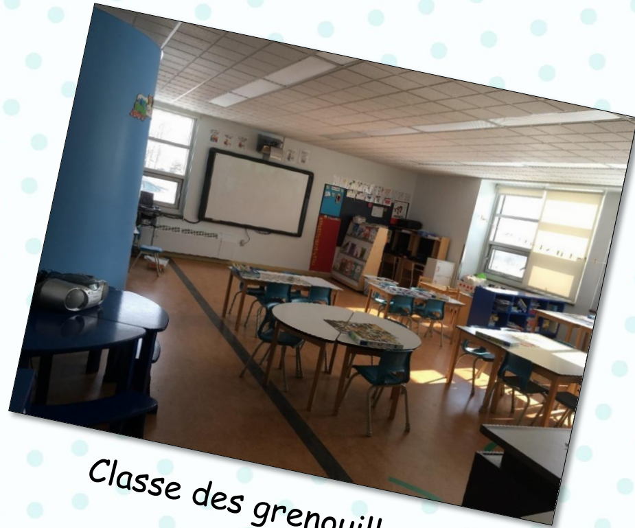
Classe des grenouilles